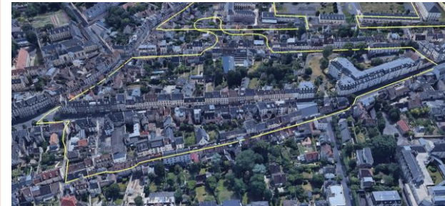
Caen (14) Bayeux Bretagne